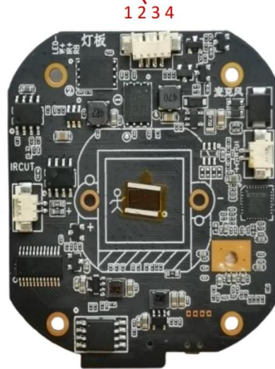
电源输入+以太网+指示灯接口